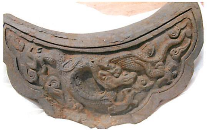
写真. 乗福寺跡第5次発掘調査地から出土した滴水瓦。

大内氏歴史文化研究会の成果として私が発表した論文の一つに、拙稿「中世西国諸氏の系譜認識」(九州史学研究会編『境界のアイデンティティ』岩田書院、2008年)がある。論文執筆のきっかけとなったのは、大内氏の菩提寺乗福寺跡地(山口市)から四爪龍の滴水瓦が出土したことにある。考古学の知見は、14世紀後半に朝鮮半島の瓦工が来日し、山口で王宮に飾るような朝鮮風の瓦を作成したとのことであった。この成果を文献史料と突き合わせると、大内義弘が活発な朝鮮通交を開始した時期と見事に合致しており、義弘が乗福寺を朝鮮風のデザインで荘厳化していたことがわかった。この事実は、大内氏が朝鮮半島との関係の深さを日本国内で目に見える形でアピールしていたことを示している。なぜそのようなことをする必要があったのであろうか。私は、新興勢力として当該期の朝鮮通交へ参入しつつあった室町幕府の足利義満の存在を義弘が意識した結果、みずからの優位性を先行して日本国内で強調する意味合いがあったのではなかろうかと考えている。