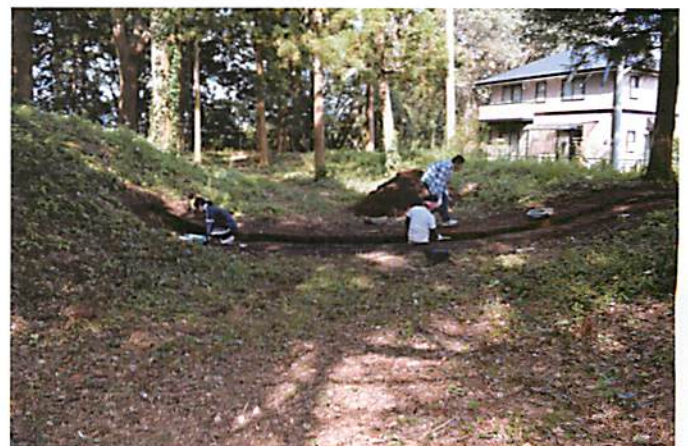
写真. 天神山古墳・調査風景.